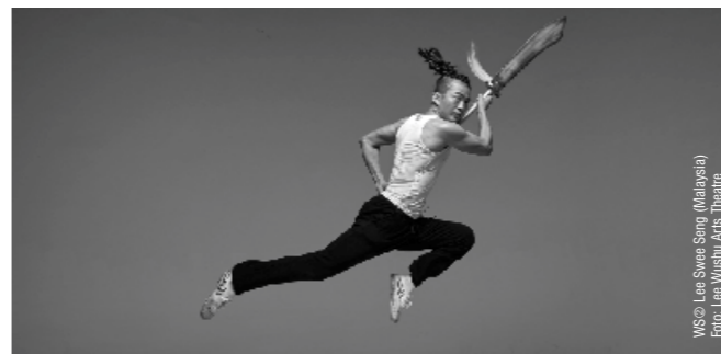
WS © Lee Swee Seng (Malaysia) Foto: Lee Wushu Arts Theatre